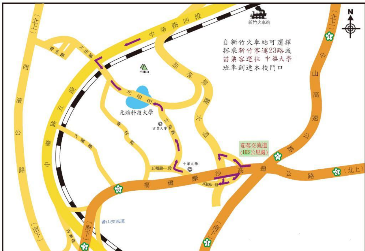
元培科技大學到校交通圖