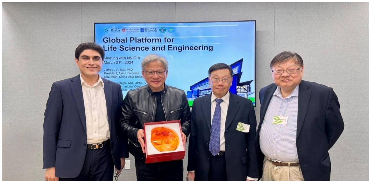
圖：亞大校長蔡進發(右 2)、美國哈佛大學醫學院 Alireza Haghghi 教授(右 4)、黃光彩講座教授(右 1)，前往 NVIDIA 總部，與 NVIDIA 創辦人黃仁勳(右 3)，針對智慧醫療領域深入交流。