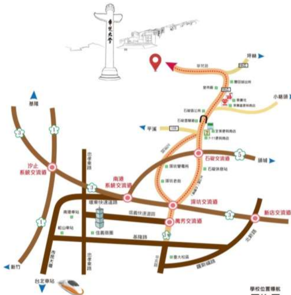
■ 華梵大學交通路線圖