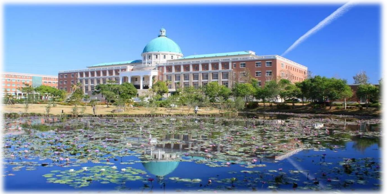
圖：就讀亞大，就是就讀一所「綜合大學」+「醫學大學」+「國際大學」