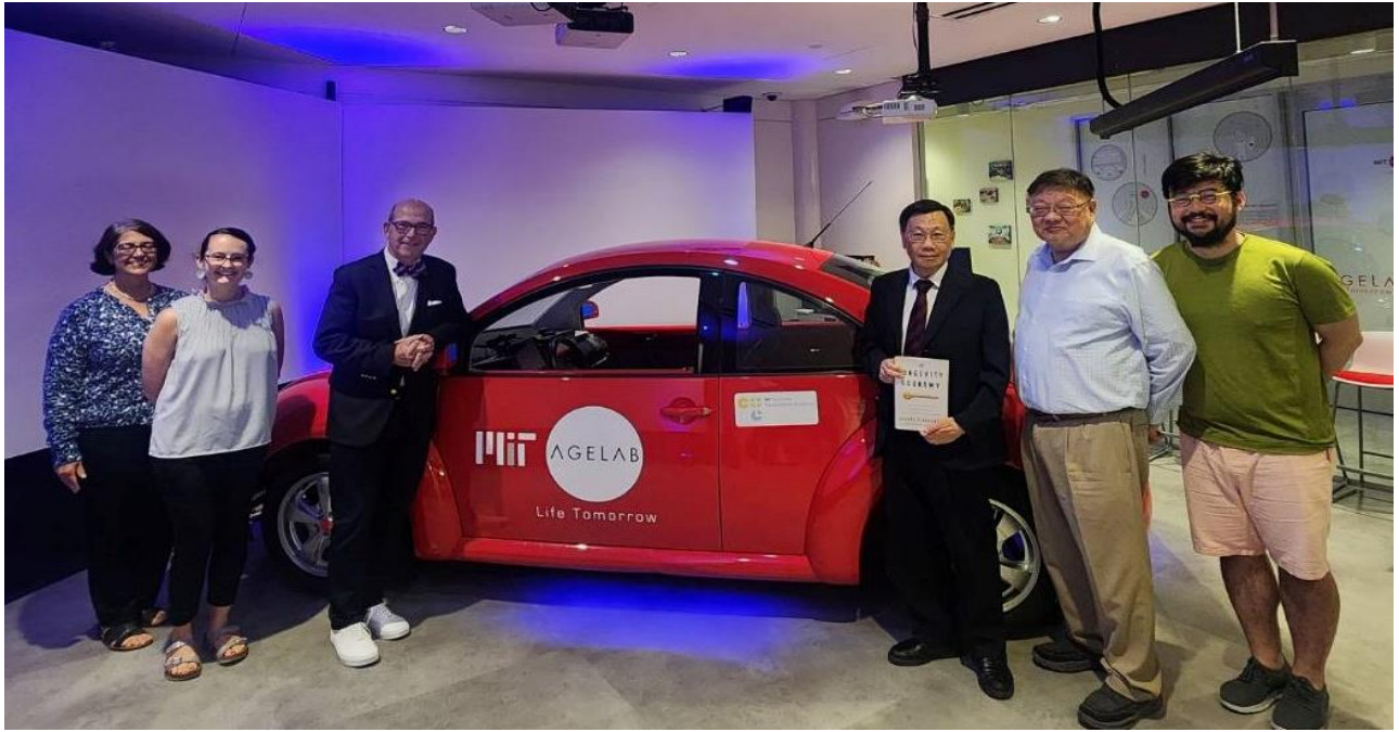
圖：亞大校長蔡進發（右 3）、亞大黃光彩講座教授（右 2），與 MIT AgeLab 年齡實驗室創辦人兼主任 Joseph F. Coughlin 教授（右 4）、AgeLab 團隊合影。