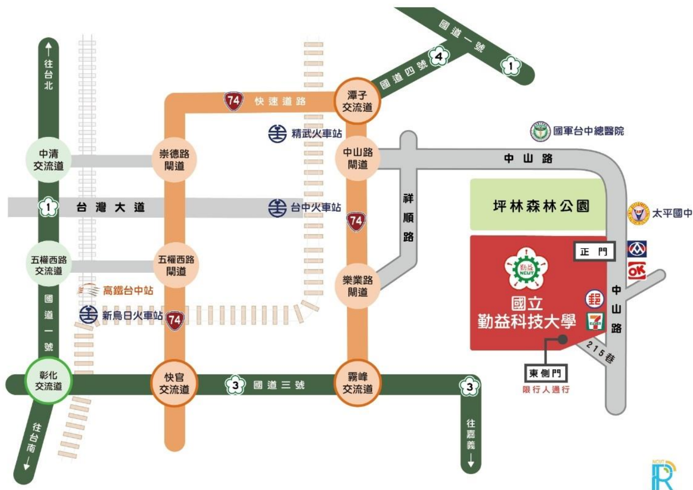
圖 1 交通路線圖(汽車)