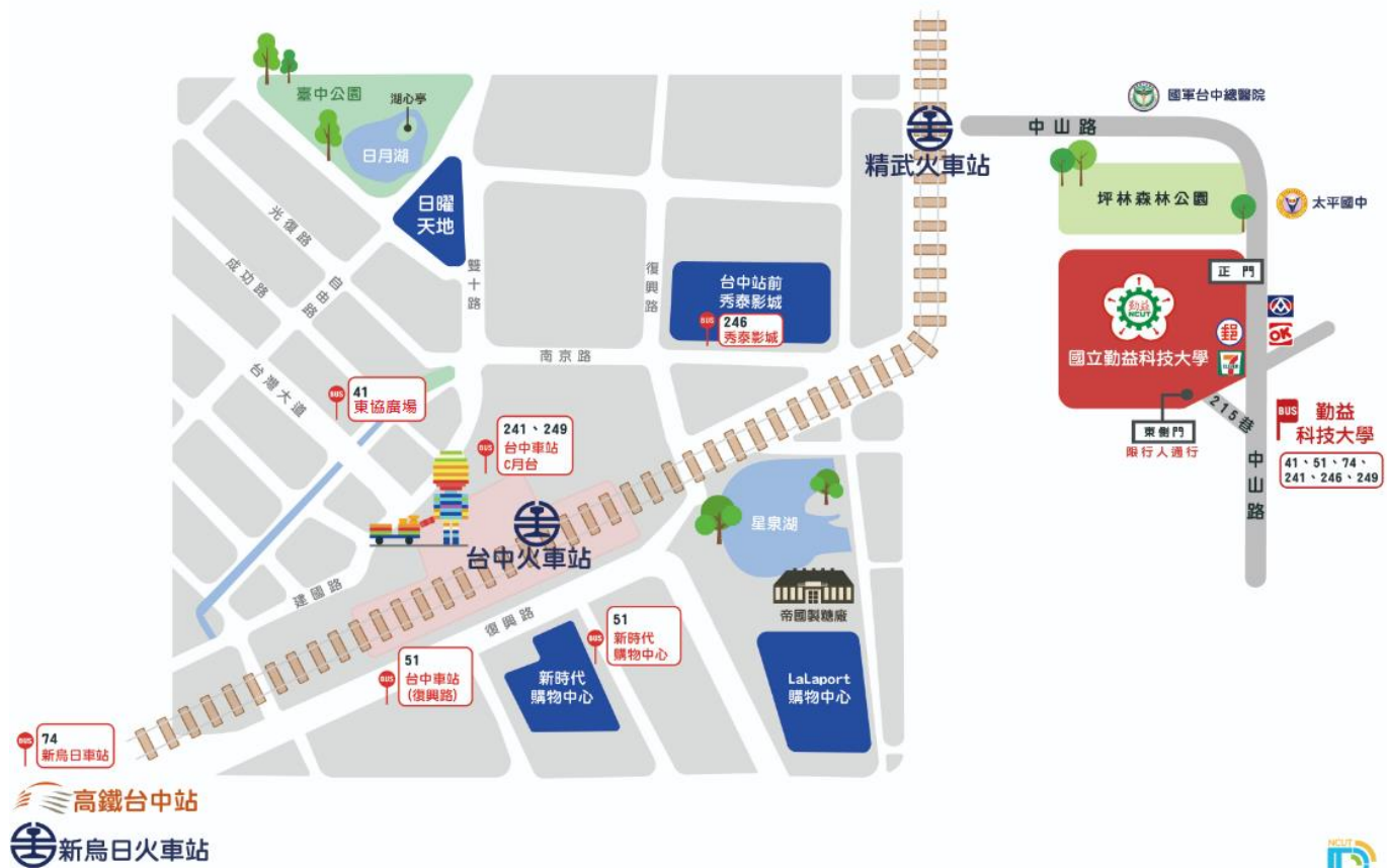
圖 2 交通路線圖(大眾運輸)