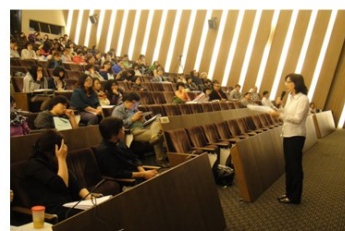
心理聯合年會-研討會