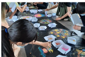
弱勢家庭生命劇場工作坊

選修科目： 諮商與心理治療技術、團體諮商與心理治療、家族治療實務、青少年與戲劇治療、伴侶與婚姻諮商、變態心理學、心理衡鑑、進階統計學、質性研究、諮商專題研究、專業實習(一)(二)、後現代家族治療與實務、生涯諮商與輔導、兒童與家庭發展專題研究等