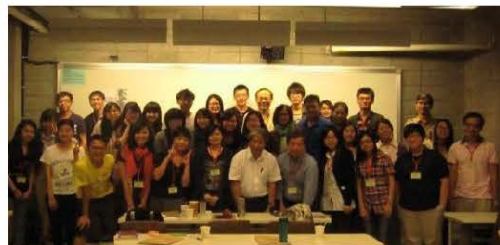
進步社會工作工作坊：香港浸會大學團隊