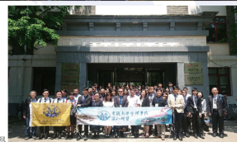
海外交流 / 蘇州大學