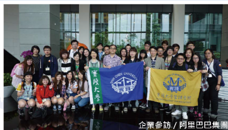
企業參訪 / 阿里巴巴集團

實踐大學財務金融學系於1992年正式成立，2006年設立研究所碩士班，本系師資團隊學術知識與實務經驗兼具，課程設計理論與實務並重，並加強金融實務運作的訓練，以配合社會與產業當前之發展趨勢，培育具備專業、資訊與實務技能兼備之金融人才。