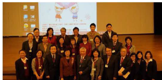
華人地區社會工作與社會福利志工國際研討會