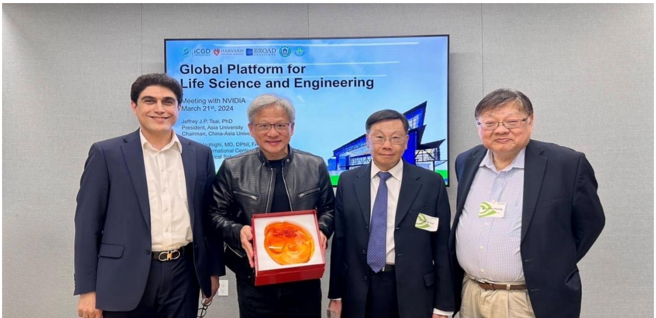
圖：亞大校長蔡進發(右 2)、美國哈佛大學醫學院 Alireza Haghghi 教授(右 4)、黃光彩講座教授(右 1)，前往 NVIDIA 總部，與 NVIDIA 創辦人黃仁勳(右 3)，針對智慧醫療領域深入交流。