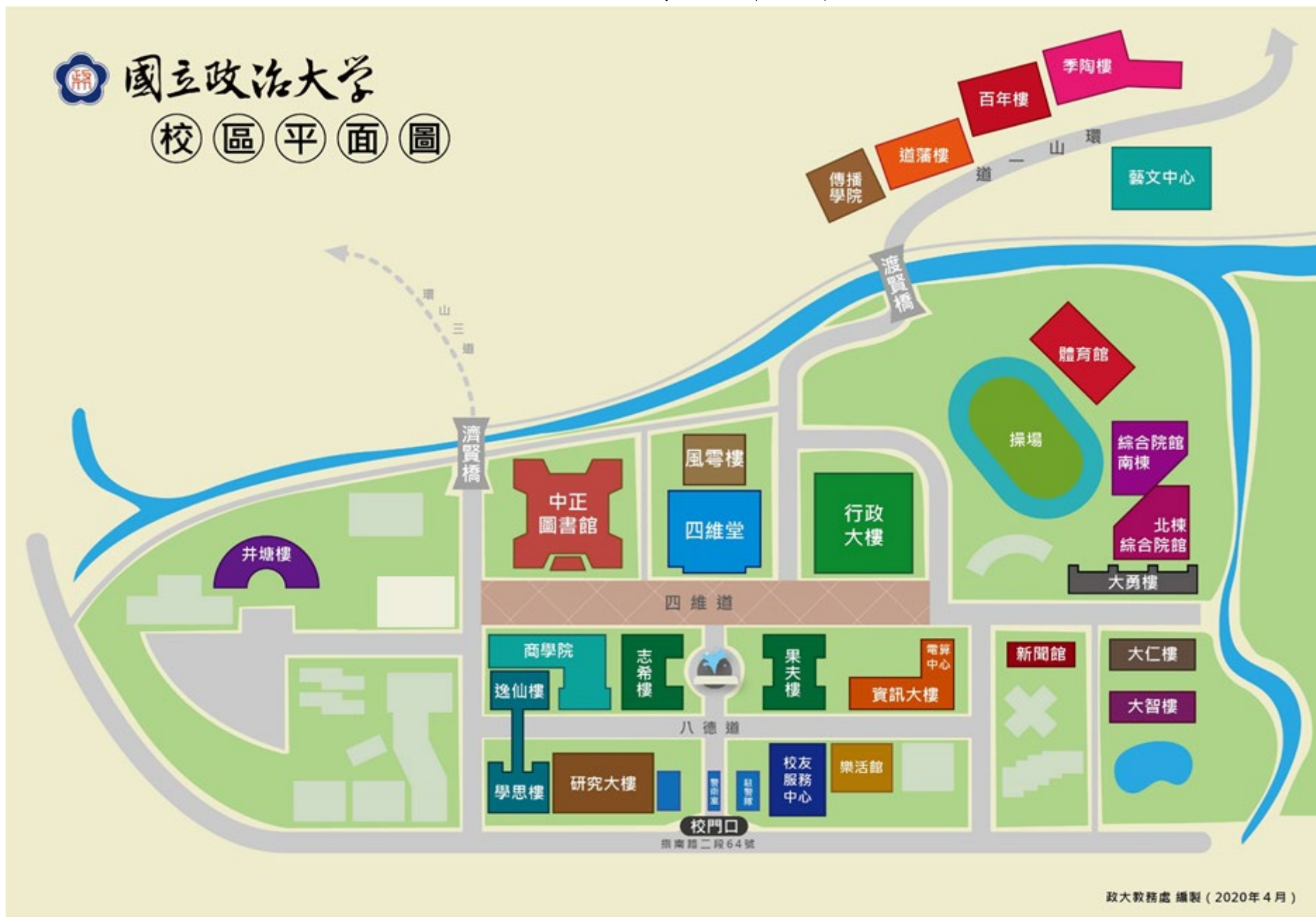
國立政治大學主要建築位置暨週邊道路圖 (校址：116011 臺北市文山區指南路二段 64 號)