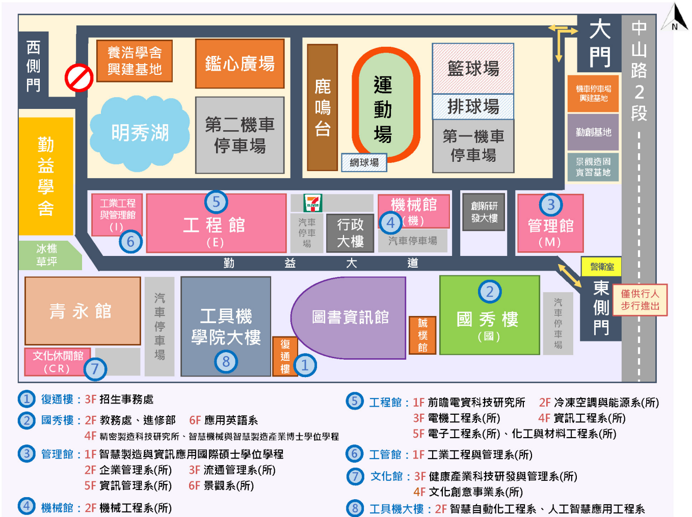
圖 2 校園位置圖