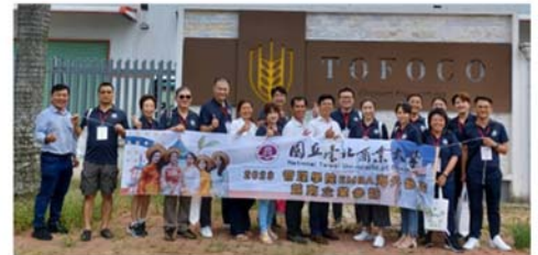
圖2 112-越南 有機農產品有限公司