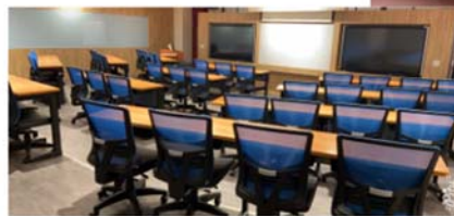
圖4-2 企管系研究所 專業教室2