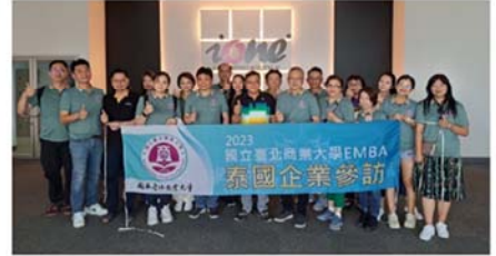
圖1 112-泰國 | ONE TECHNOLOGY (THAILAND) CO., LTD.

本系碩士在職專班於民國95年成立，每年均與在學碩士生共同辦理諸多活動，包括於年初辦理春酒、年中辦理迎新送舊及年末辦理秋遊，以增進校友間及師生間的聯繫與互動。