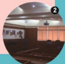
▲圖1 研究生研究室 ▶圖2 企管系研究所專業教室