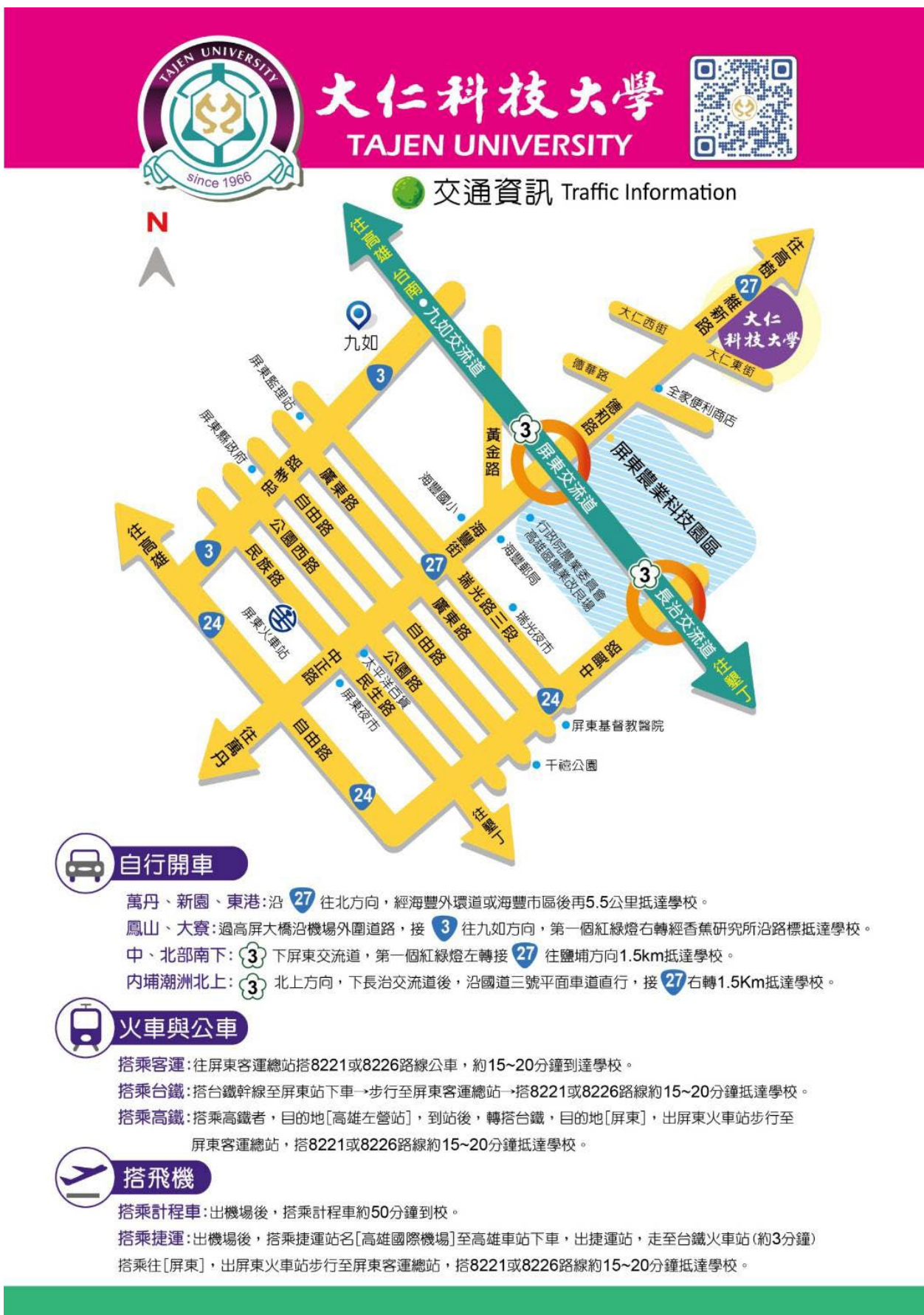
附表九 大仁科技大學交通路線圖