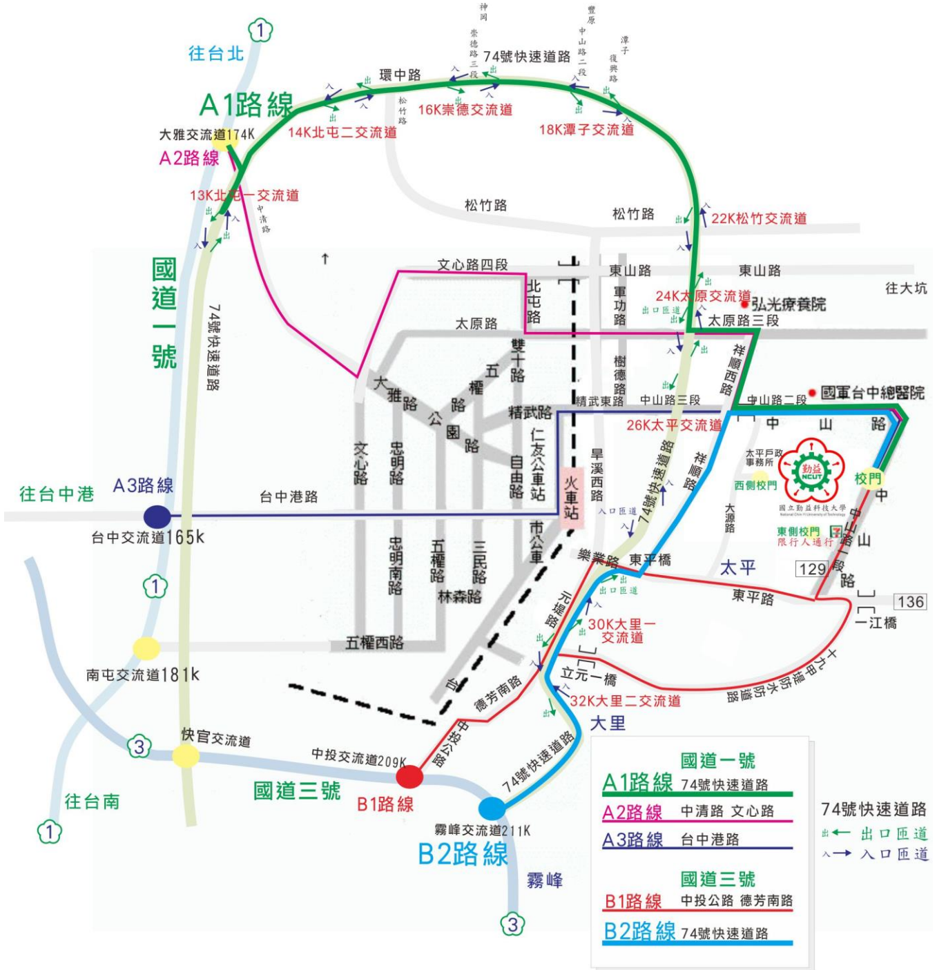
圖 1 交通路線圖