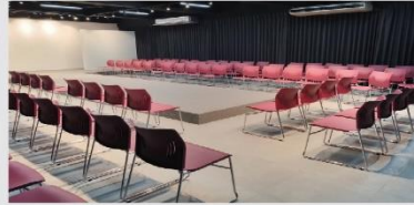
藝人展演暨走秀教室