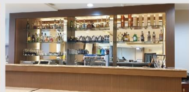
實習旅館輕食吧檯