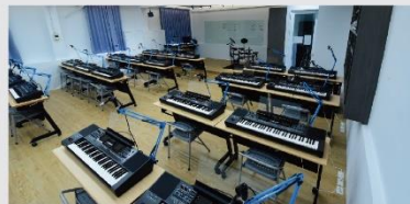
歌唱及音樂專業教室