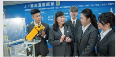
JIT物流運籌建置模擬教室