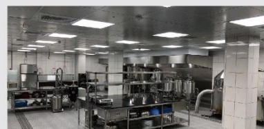
FB05-酒類釀造暨巧克力工藝實作教室