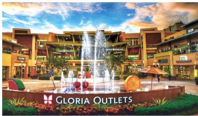
GLORIA OUTLETS 華泰名品城