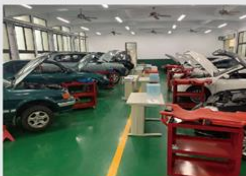
汽車乙級術科檢定場地設備(第四五站)