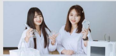
植萃化妝品配方設計 & 檢測中心