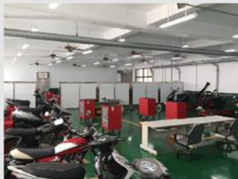
機器腳踏車乙級術科檢定場地設備