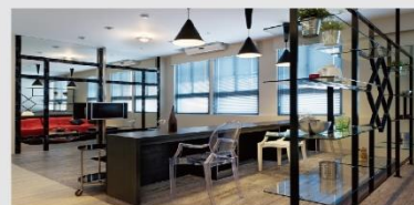
室內設計實習教室