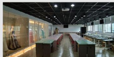
整體造型專業教室