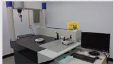
蔡司三次元量測儀