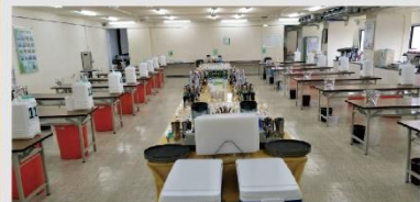
國家技能檢定飲料調製專業教室