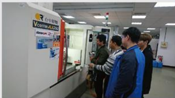
五軸同動加工機、車銑複合加工機