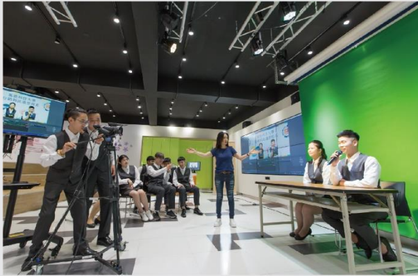
勞動部賈桃樂網紅直播專業教室