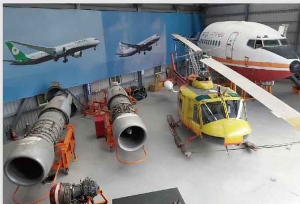
飛機與發動機維修實習區