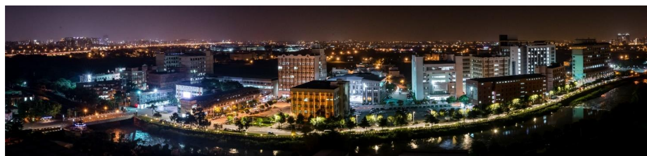
萬能科技大學全景