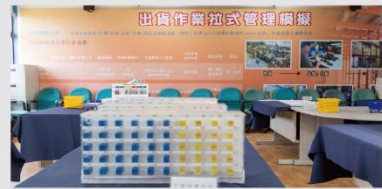
出貨作業拉式管理模擬教室