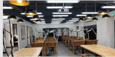
珠寶設計暨金工創作工坊