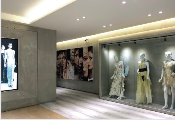
設計學院1樓門廳-流行時尚廊道