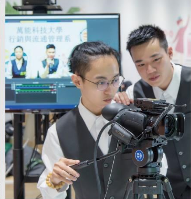
專業多媒體實作訓練