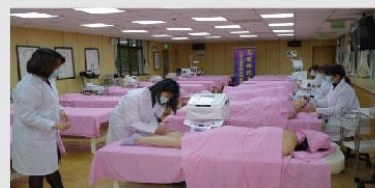
美體沙龍/醫學美容教學研究中心