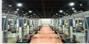
美髮暨頭皮管理專業教室