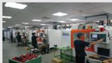
勞動部CNC銑床乙級技術士考場