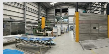
複材產品開發類工廠