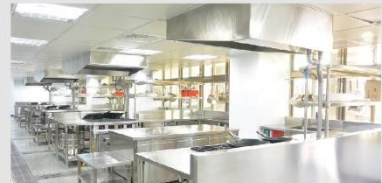
廚藝複合多功能教室V203