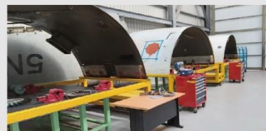
飛機結構維修實習區