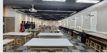
流行服飾設計教室