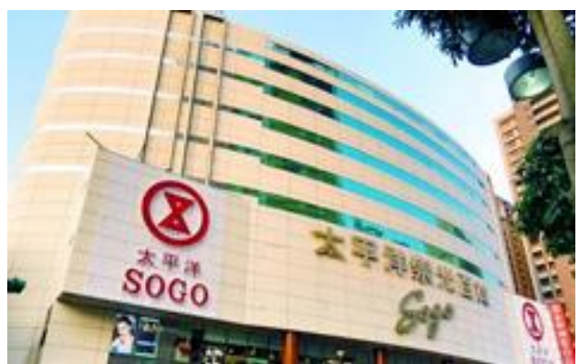
遠東 SOGO 中壢店