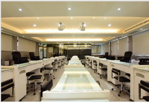
藝術美甲眉睫半永久妝專業教室