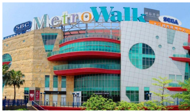
大江國際購物中心