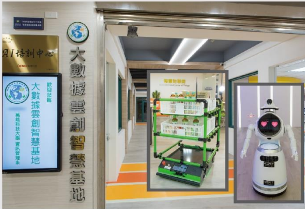
大數據雲創智慧基地