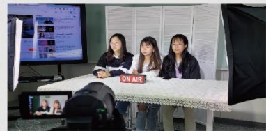
創意直播網紅體驗教室