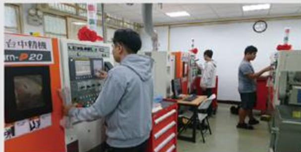
勞動部CNC車床乙級技術士考場