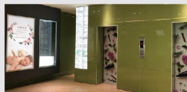
設計學院2樓門廳-芳香美容