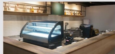
FB01-V吧-溫馨咖啡專業吧檯