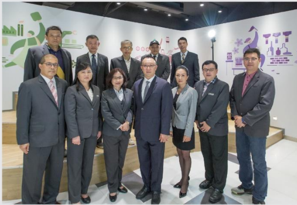
陣容堅強專任教師團隊