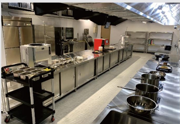
FB02-智慧餐旅創新中心