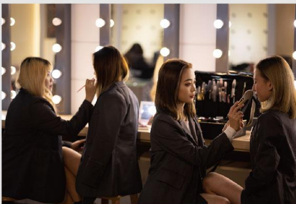
彩妝美顏技術培訓中心