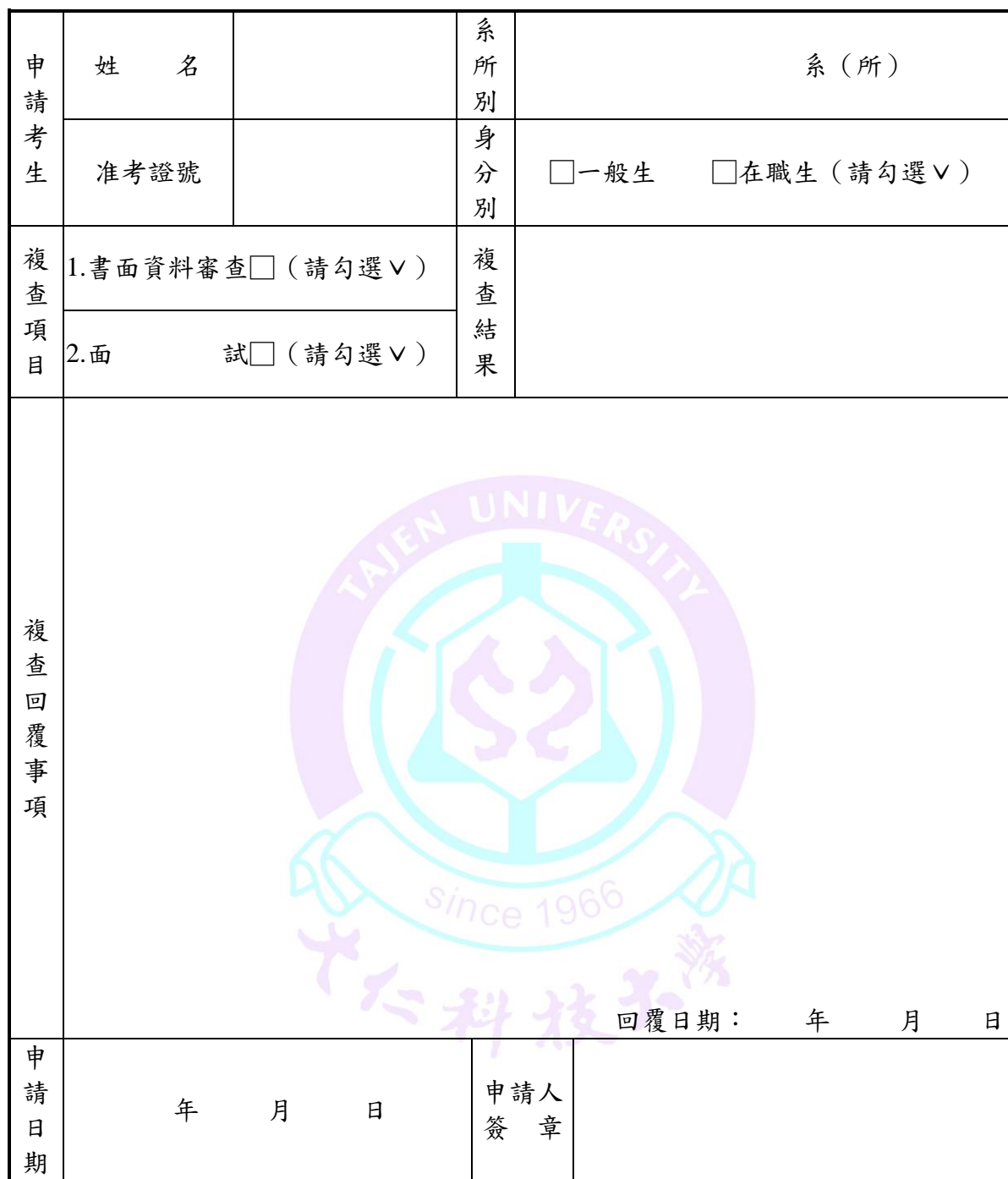
附表(九) 大仁科技大學 110 學年度研究所碩士班甄試入學招生成績複查申請表