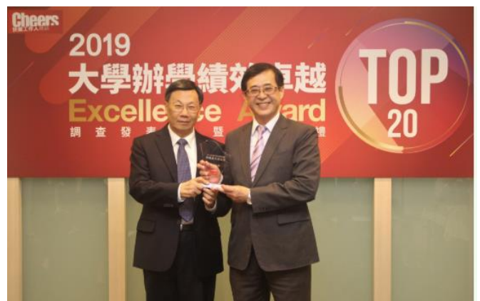
(圖：大學辦學績效 TOP20，亞大全台第 5 名！)