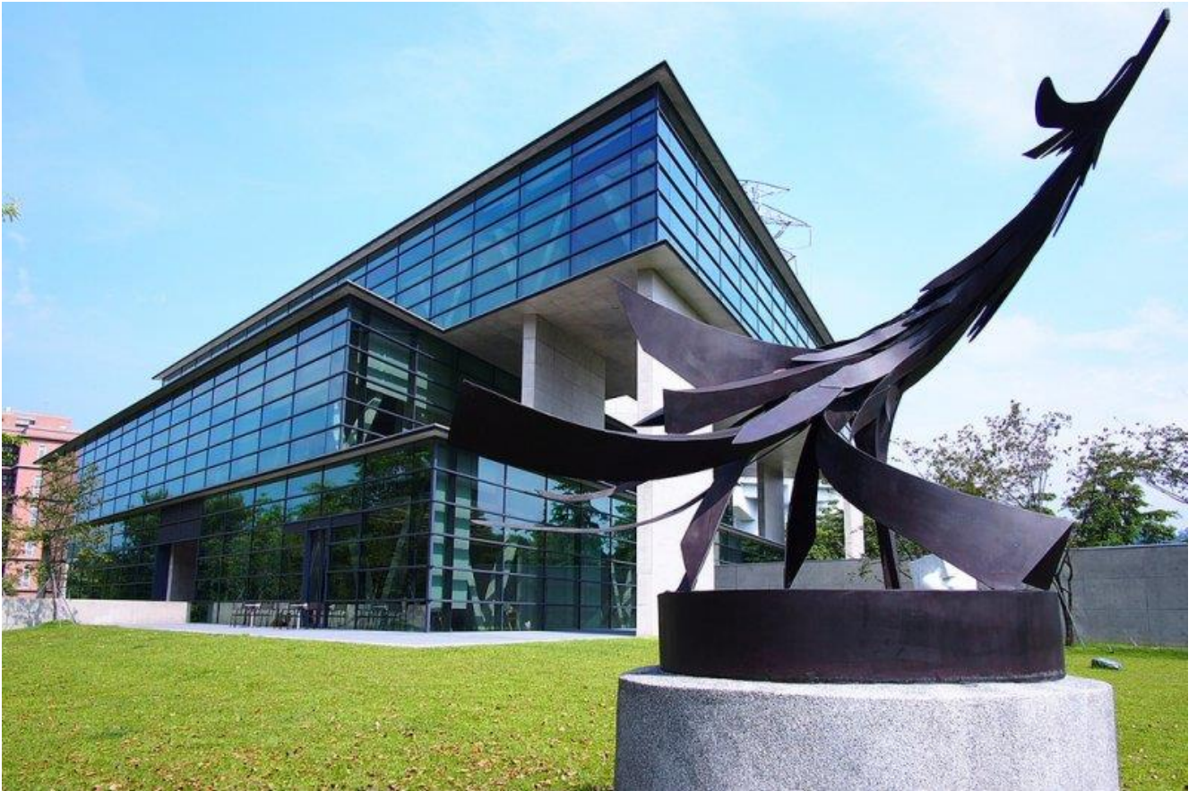
圖：中國時報舉辦「大專校院校園風景網路人氣票選」亞大安藤美術館入選全台校園十大美景！