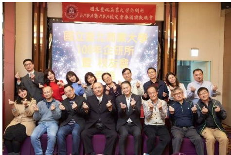
圖 5 108 年春酒

二、本系碩士在職專班於民國 95 年成立，每年均與在學碩士生共同辦理諸多活動，包括於年初辦理春酒、年中辦理迎新送舊及年末辦理秋遊，以增進校友間及師生間的聯繫與互動。