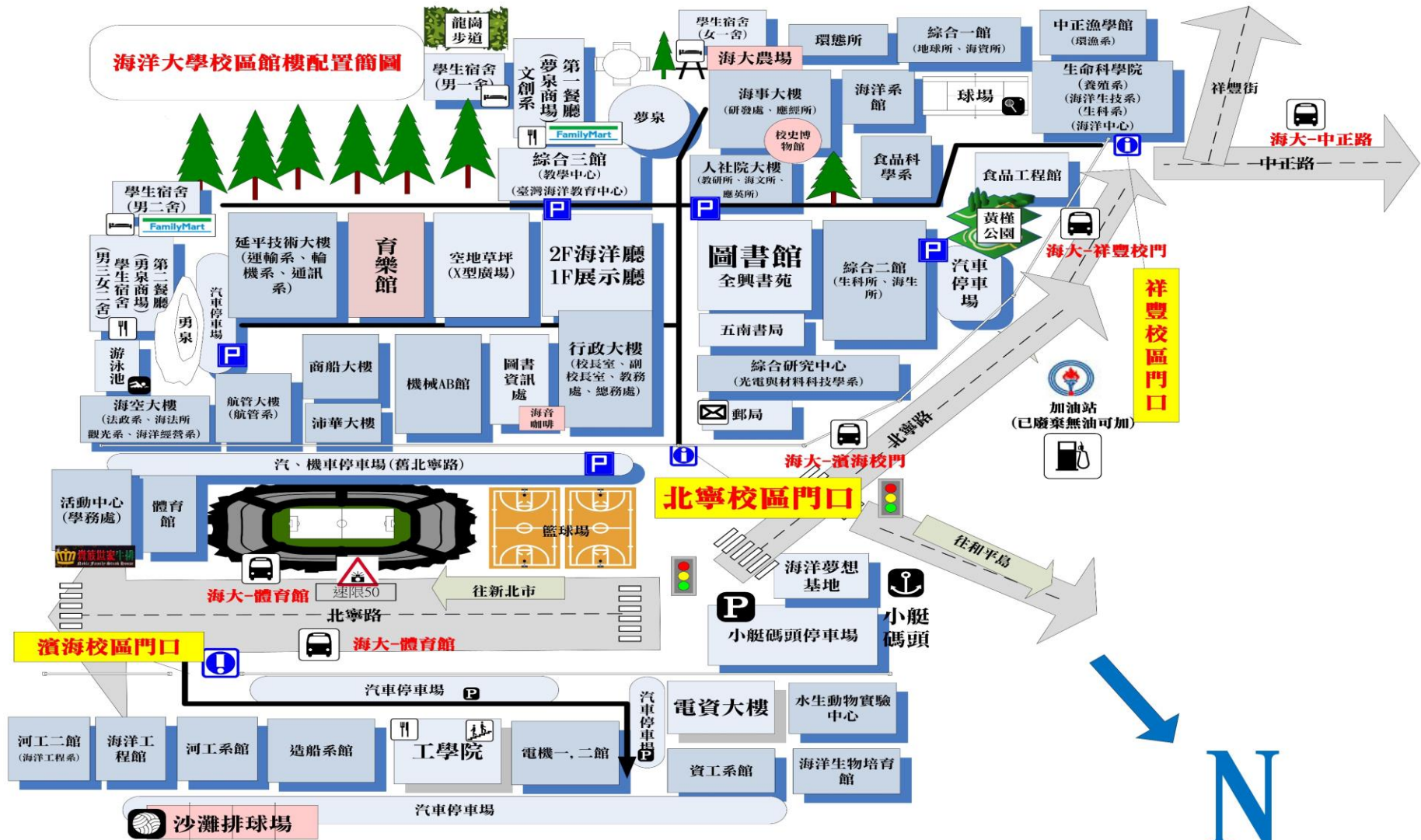
海洋大學校區館樓配置簡圖