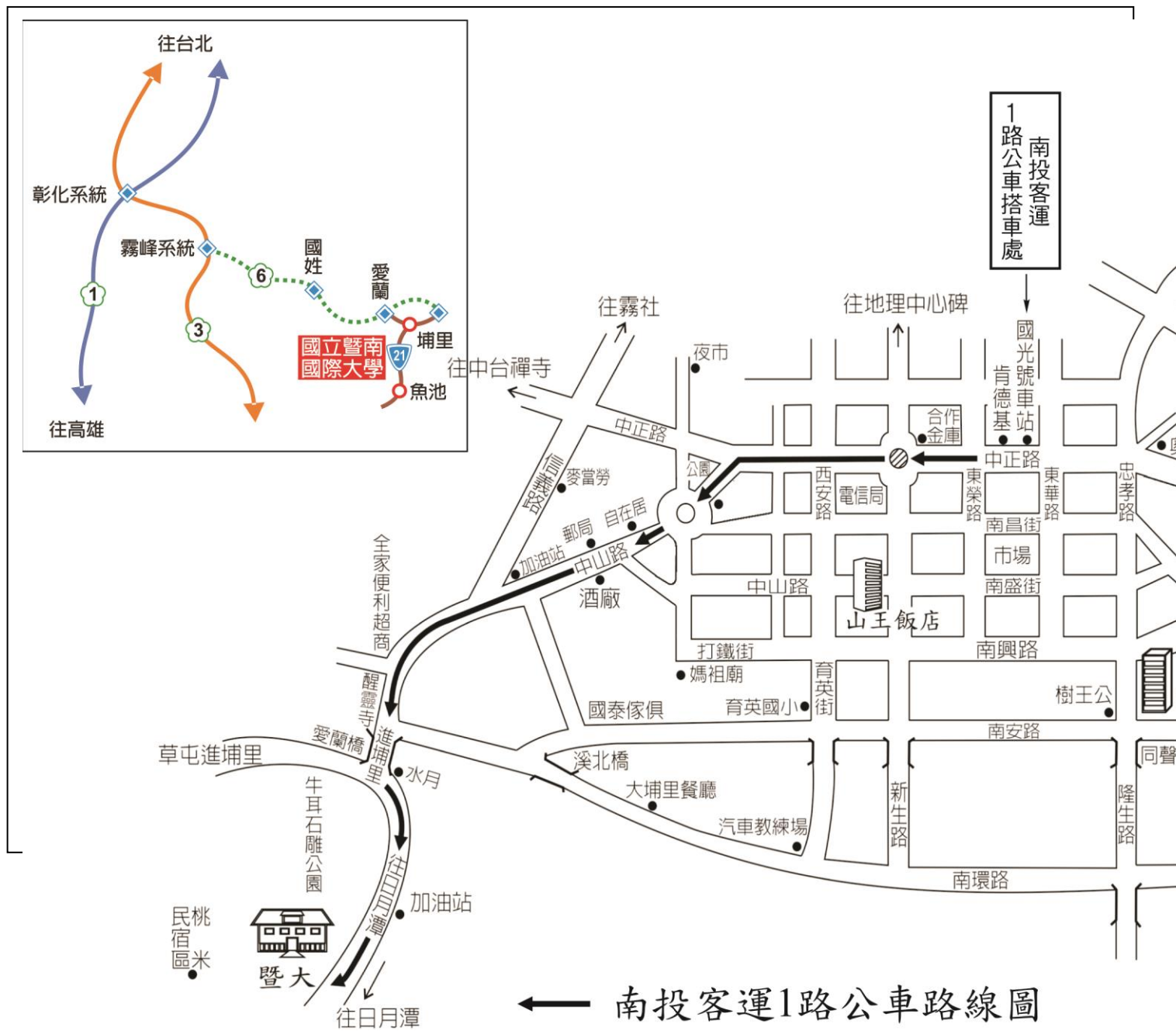
南投客運 1 路區間公車路線圖